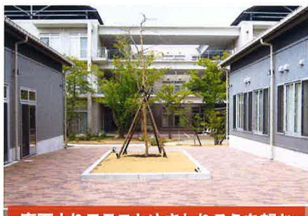
廊下よりテラスとゆきわりそを望む