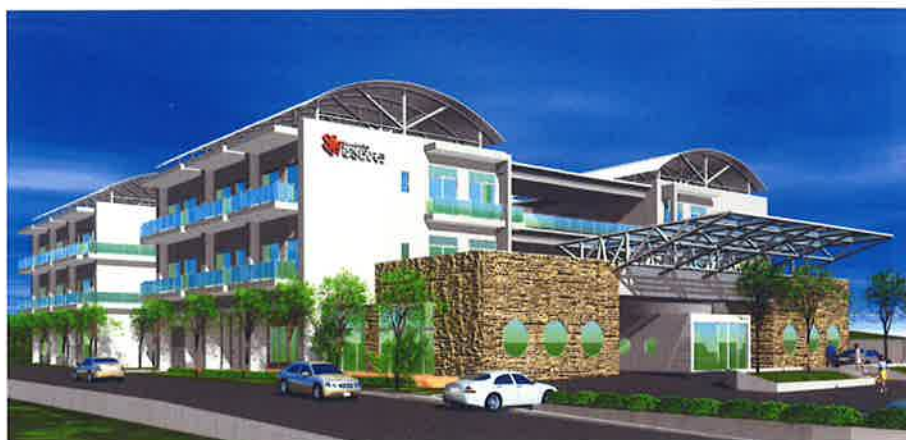
特別養護老人ホームゆきわりそう