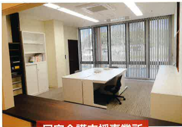
居宅介護支援事業所