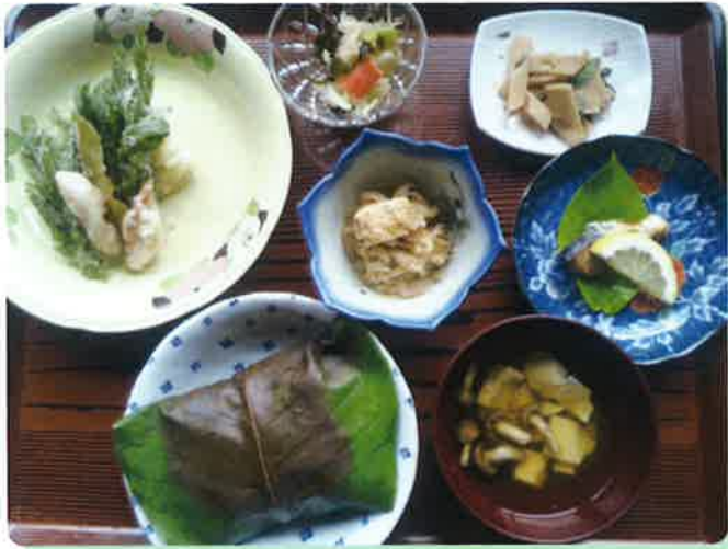
朴葉焼きと山菜天ぷら