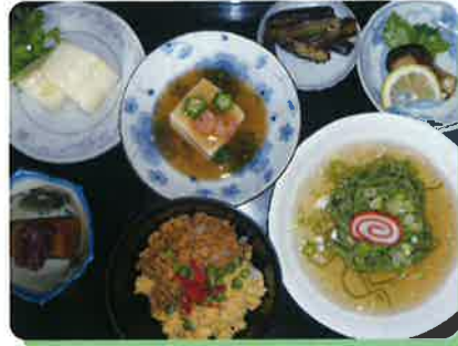
抹茶冷麺と鶏そぼろ丼

専属の調理師がご利用者様のご希望に添い 食を楽しんで頂けるよう リクエストにもお応えしております!