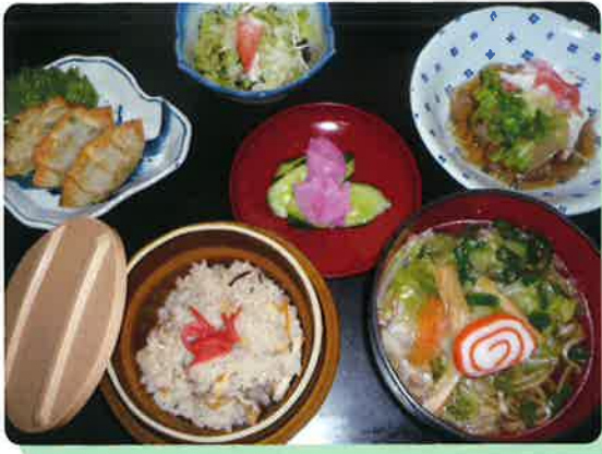
みはらしの家特製釜めし

専任の調理師が食材を使った手づくり料理をお出し致します。 新鮮な地元食材を提供しています。