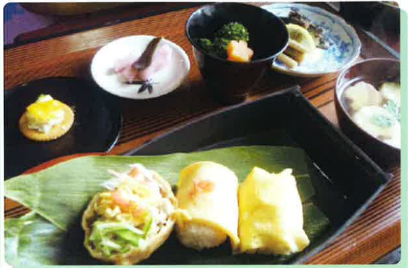
特製いなりとお寿司