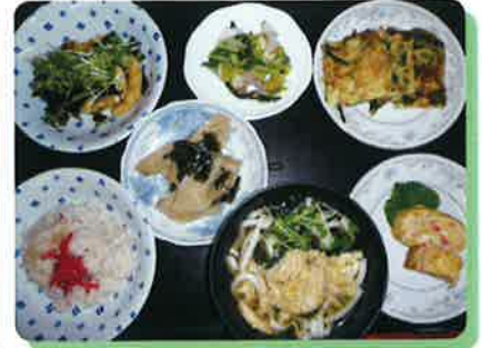
鶏卵うどんと和風チヂミ