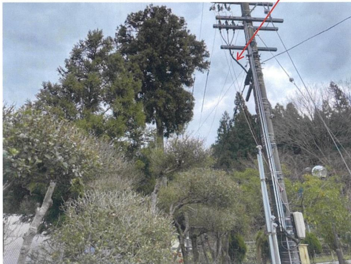
R6.1.1の地震により、構内柱が傾いたため、R7.12.15に電柱傾きを修正した。写真の様に端末処理部の絶縁ゴムが溶けてボルトが出ていた。