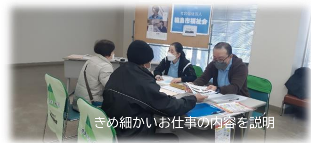
きめ細かいお仕事の内容を説明