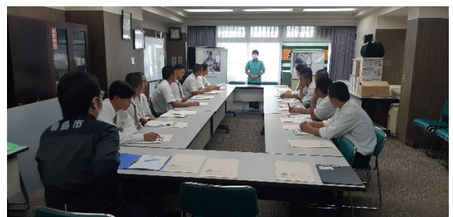
真剣に企業の説明を聞く門前高校生徒の皆さん