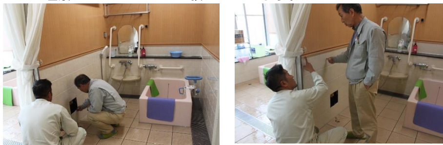
工事に関する打合せの状況

デイサービスセンターの浴室の壁を全面張替えをします。平成30年12月3日から12月12日の10日間はデイサービスセンターの浴槽は使用できません。特別養護老人ホームの浴槽の使用となりますのでご理解のほどよろしくお願いいたします。