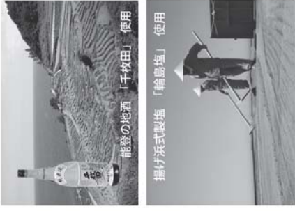
能登の地酒「千枚田」使用 揚げ浜式製塩「輪島塩」使用