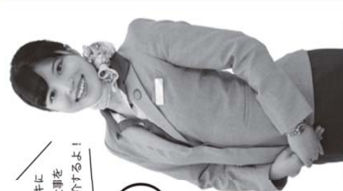
ヒコキキに 関わる仕事を 分かり易く紹介するよ!

9月9日(土) 開催時間 12:30~15:00 受付開始 12:15~ のと里山空港 にて初開催!